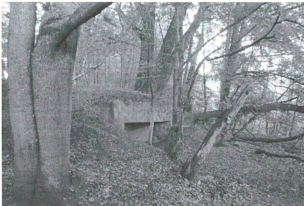
Schron z 1939 r. pod wsią Bolejny