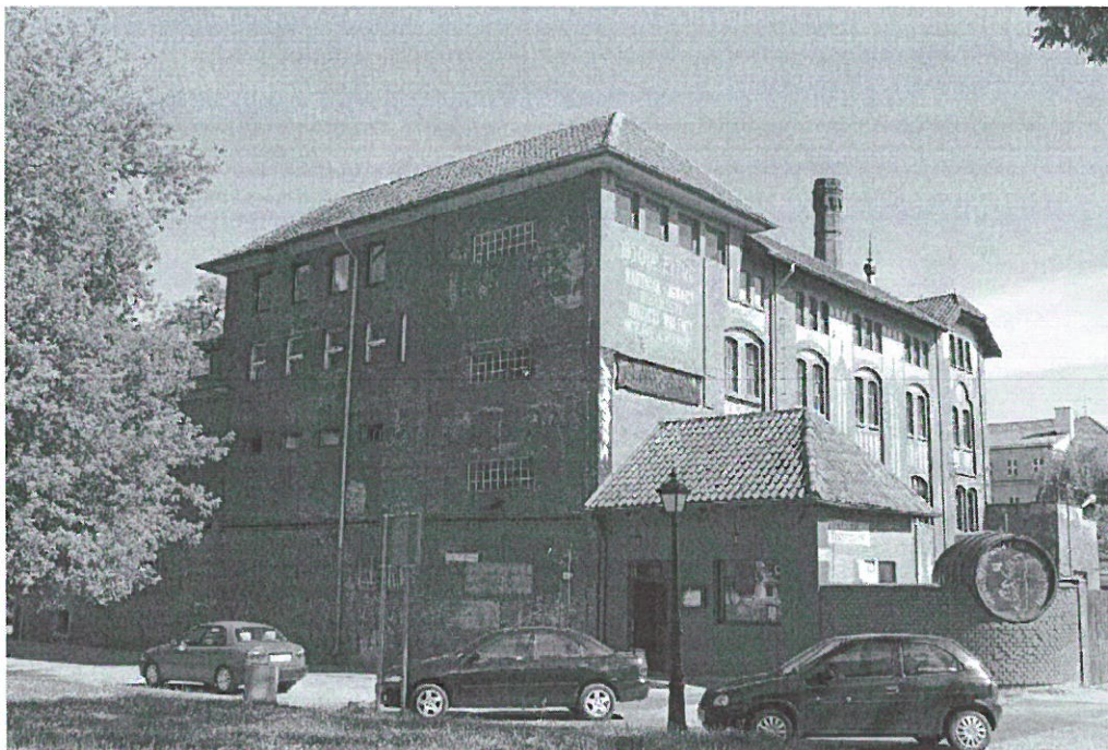
Browar w Nidzicy