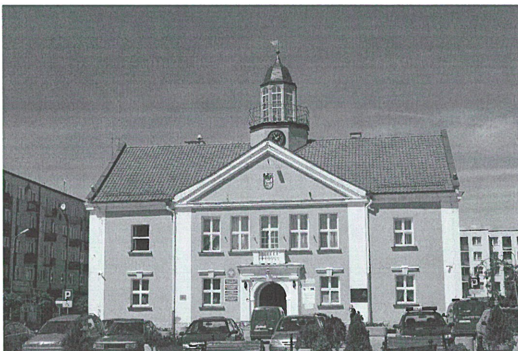
Ratusz w Nidzicy

Na terenach wiejskich największą grupę budowli użyteczności publicznej stanowią szkoły wznoszone od drugiej połowy XIX w. Były to zespoły zabudowań składające się z budynku głównego z pomieszczeniami klasowymi oraz mieszkaniami nauczycieli oraz zabudowy gospodarczej wykorzystywanej przez nauczycieli. Są to budynki w większości jednokondygnacyjne, czasem na podmurówce, z gankami, wyróżniające się detalami architektonicznymi na tle typowej zabudowy mieszkaniowej. Charakteryzuje je szczególna lokalizacja – w centralnej części wsi.