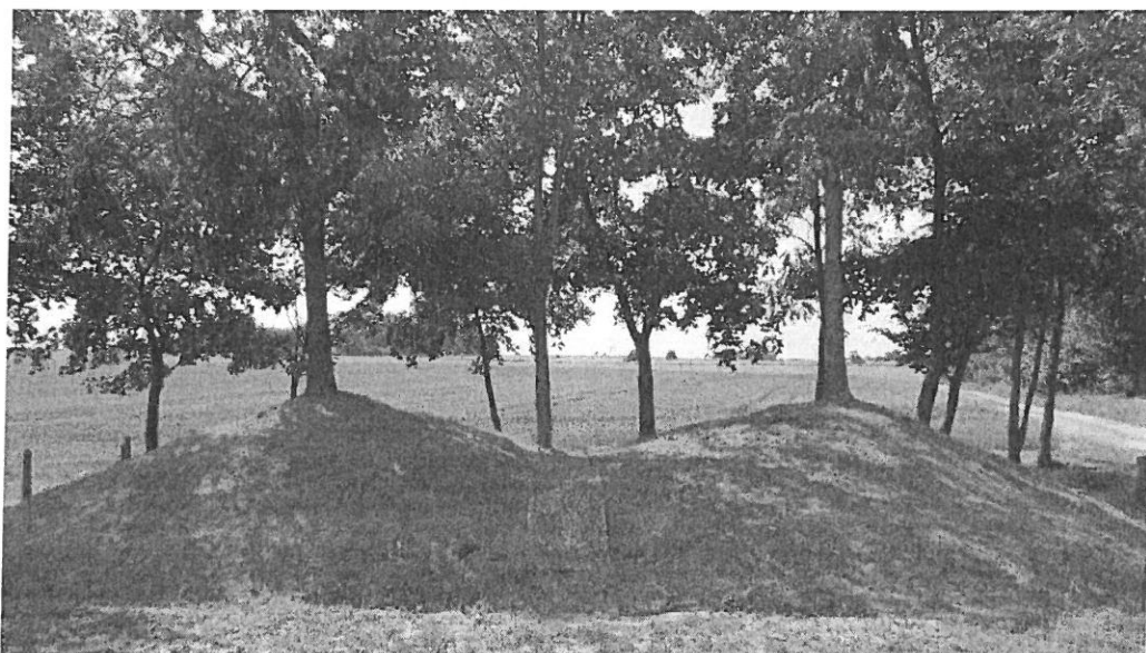
Jeden z czterech cmentarzy z czasów I wojny światowej na gruntach wsi Frąknowo