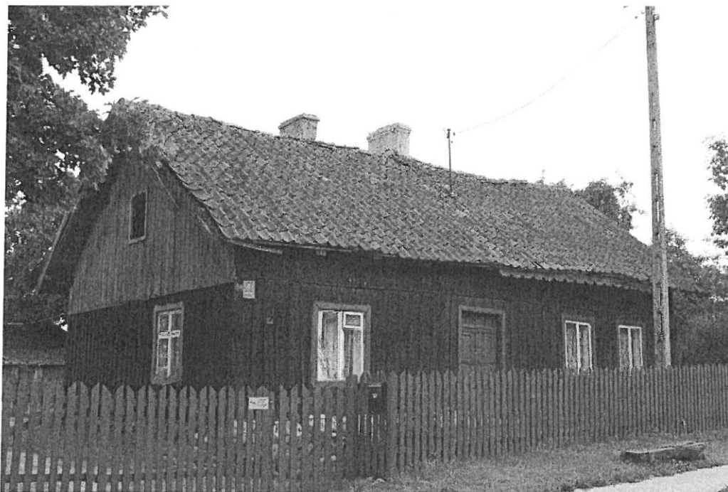
Drewniany dom z końca XIX w. we wsi Grzegórzki

przypadku zabudowy drewnianej najbardziej powszechna była konstrukcja zrębowa. Budynki murowane można podzielić na dwa ogólne typy: budynki tynkowane oraz budynki wznoszone z czerwonej, licowej cegły. Te ostatnie stały się charakterystycznym elementem pejzażu Warmii i Mazur. Zasadnicze wypełnienie przestrzeni wsi stanowiła zabudowa mieszkaniowa i gospodarcza. Typowy układ to zagroda z domem mieszkalnym od frontu i zabudowania gospodarcze w obrębie podwórka. Tradycyjne budownictwo to domy w większości drewniane, które w XIX wieku zostały na tym terenie częściowo zastąpione budynkami murowanymi z czerwonej cegły, a niekiedy tynkowane. Wznoszone na planie prostokąta, w większości jednokondygnacyjne, nakryte dachem dwuspadowym (ceramicznym), ustawione zarówno kalenicowo jak i szczytowo do drogi. Dla większości domów typowe są kolorowe opaski okienne i drzwiowe. Spotkać można również domy okazalsze, dwukondygnacyjne, na podmurówce, z wystawkami w partii dachowej z osobnym daszkiem dwuspadowym, z gankami, czasem kryte dachem naczółkowym. Budynki gospodarcze były w większości drewniane, obecnie murowano – drewniane, pojedynczo można spotkać szachulcowe.