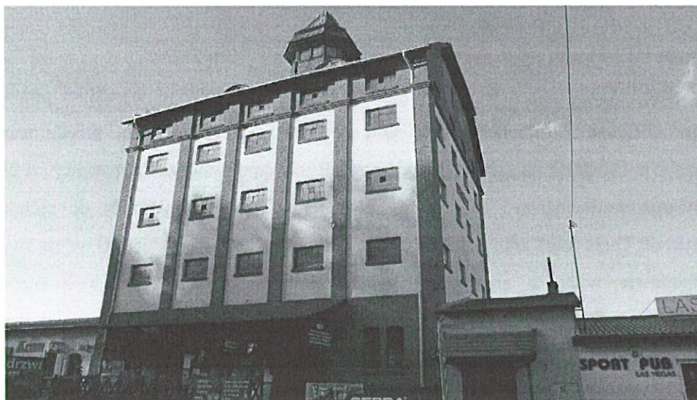
Dawny spichlerz przy ul. Olsztyńskiej w Nidzicy