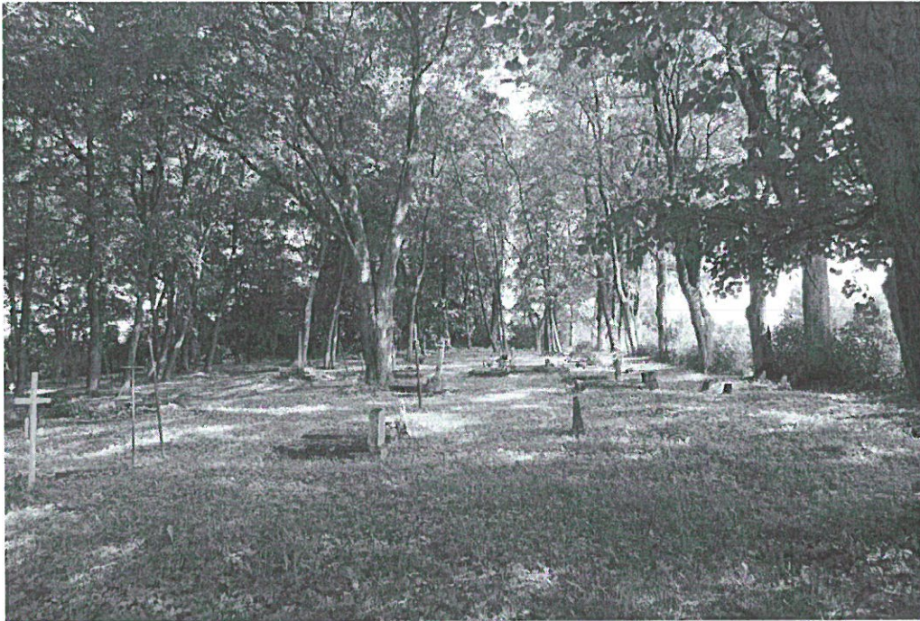
Wnętrze cmentarza ewangelickiego przy ul. Limanowskiego w Nidzicy