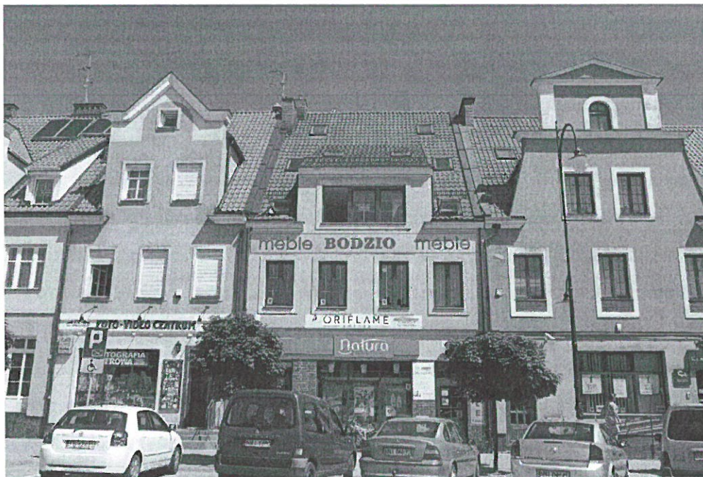
Kamienice przy Placu Wolności w Nidzicy

kamienice wznoszone przy głównych ulicach lub budynki jednorodzinne położone w dzielnicach peryferyjnych. Charakterystycznym elementem krajobrazu kulturowego miast mazurskich są osiedla domów socjalnych wznoszonych od połowy lat 20. do połowy lat 30. XX w. w inicjatywy Gauleitera Prus Wschodnich Ericha Kocho.