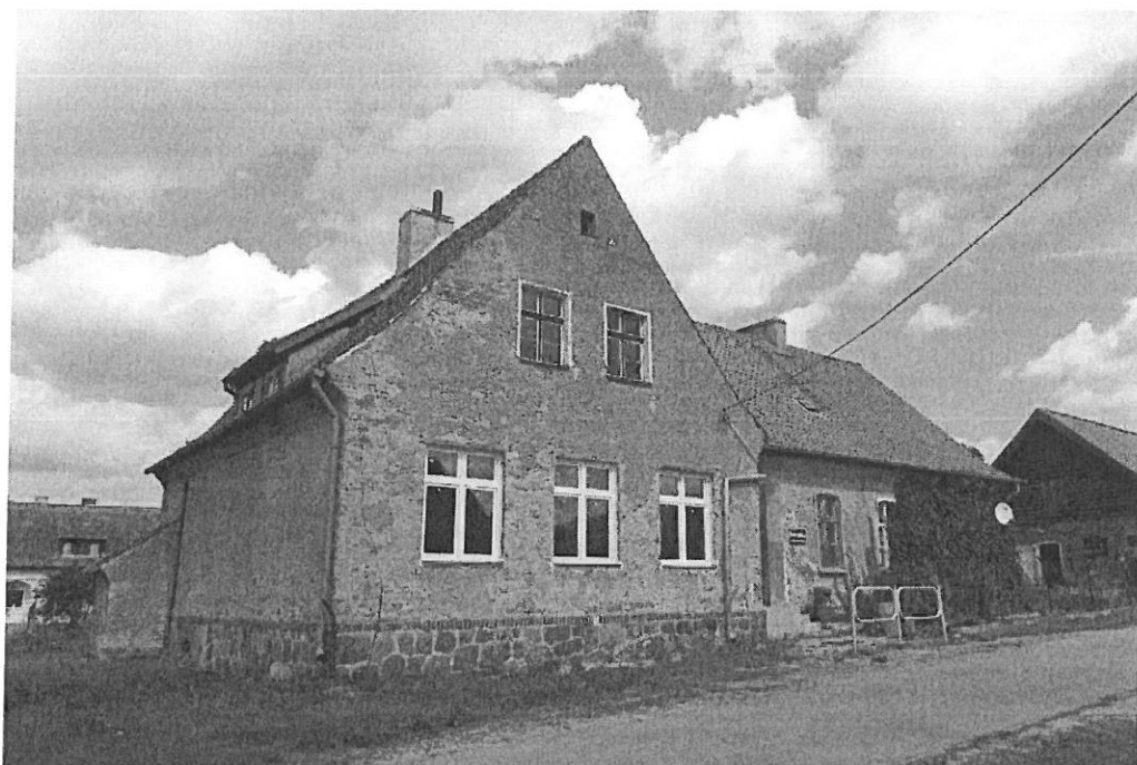
Budynek szkoły wiejskiej w Bartoszkach