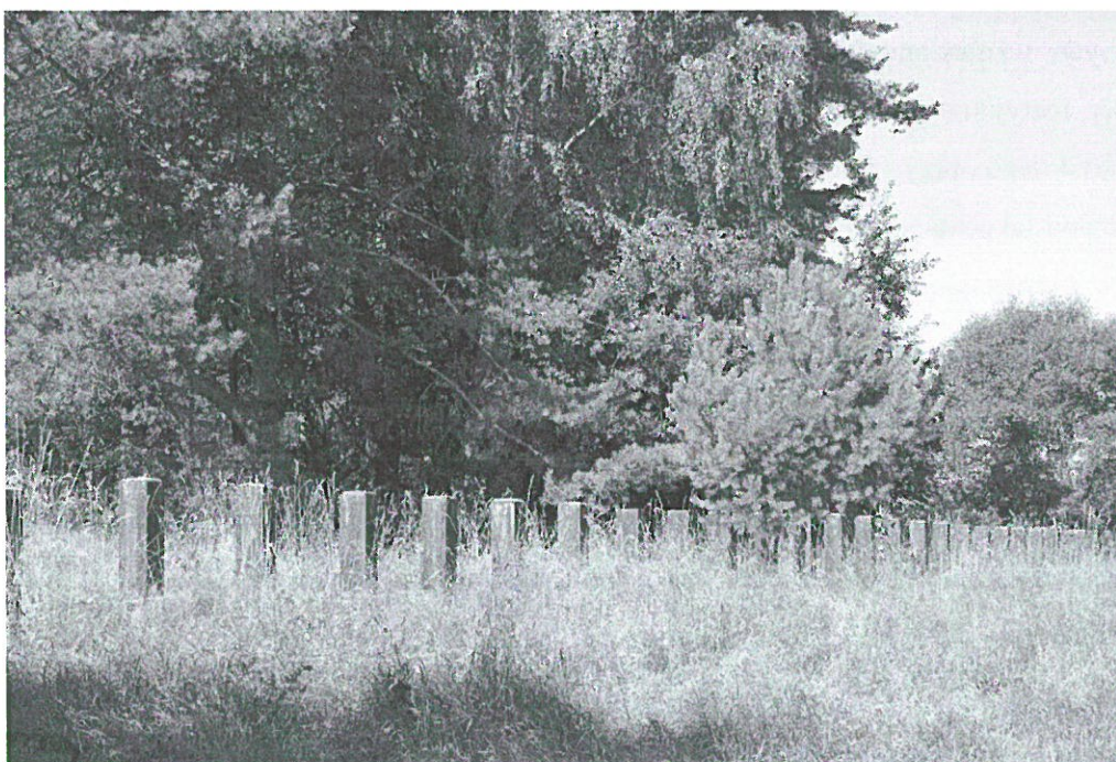
Zapora przeciwczołgowa pod wsią Bolejny