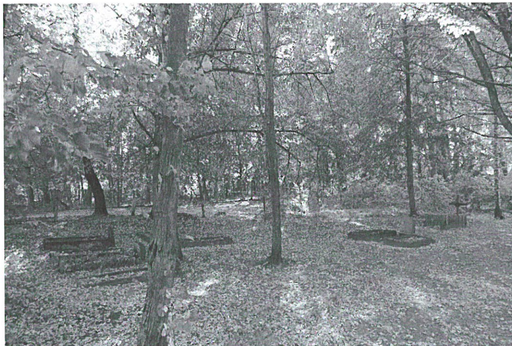
Cmentarz ewangelicki w Nataci Małej