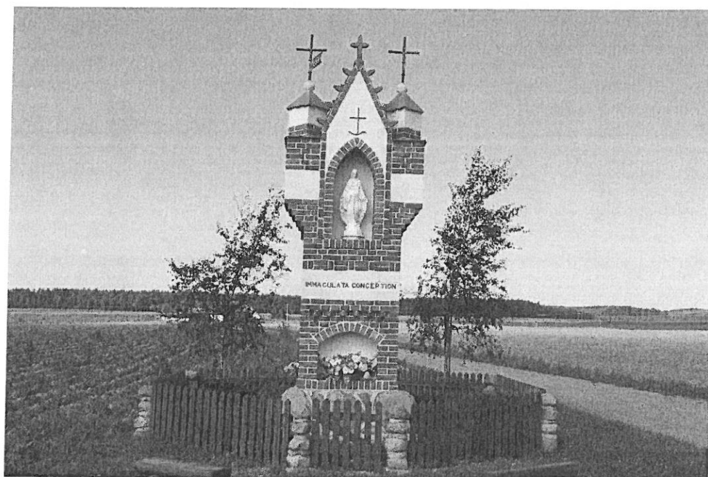
Kapliczka przydrożna w Radominie