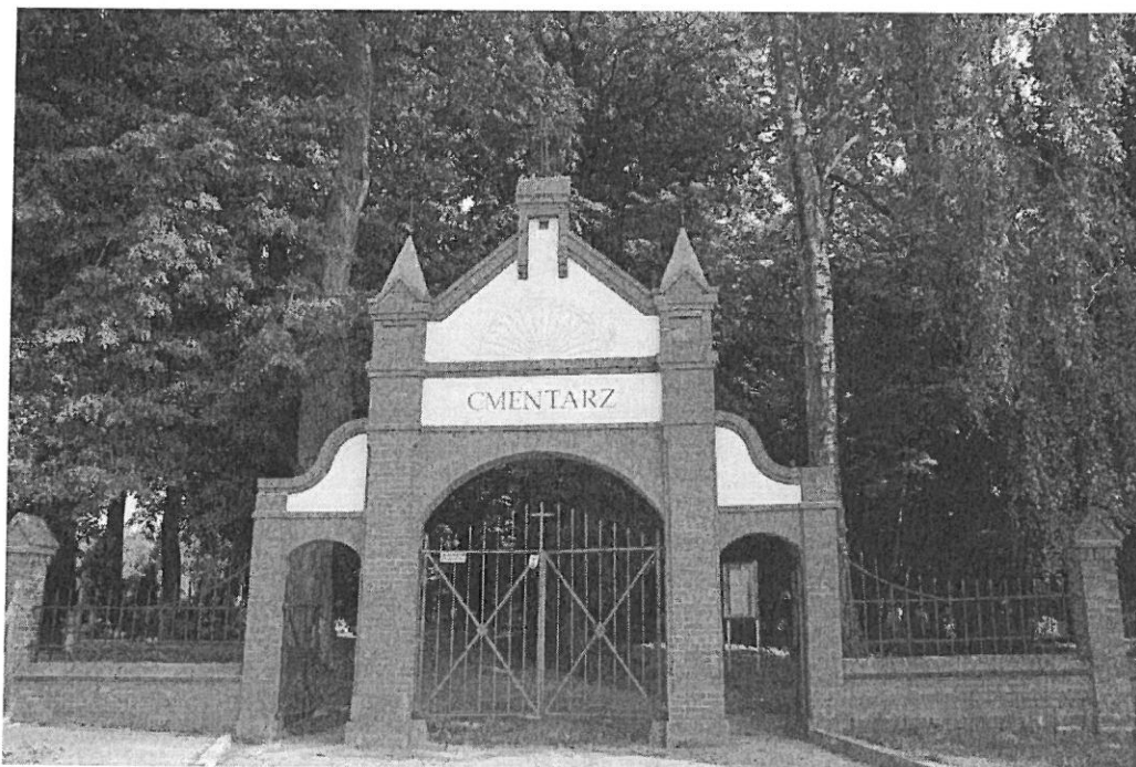
Brama cmentarza przy ul. Warszawskiej w Nidzicy

Na terenie gminy Nidzica znajdujemy cmentarze ewangelickie, w przewadze współcześnie nieczynne, mniej liczne cmentarze katolickie oraz cmentarze wojenne, najliczniejsze z czasów I wojny światowej. Stan zachowania zabytkowych cmentarzy cywilnych na terenie gminy nie należy do najlepszych. Wynika to przede wszystkim z zapomnienia i aktów wandalizmu które miały miejsce w przeszłości, najintensywniej w okresie tuż po II wojnie światowej.