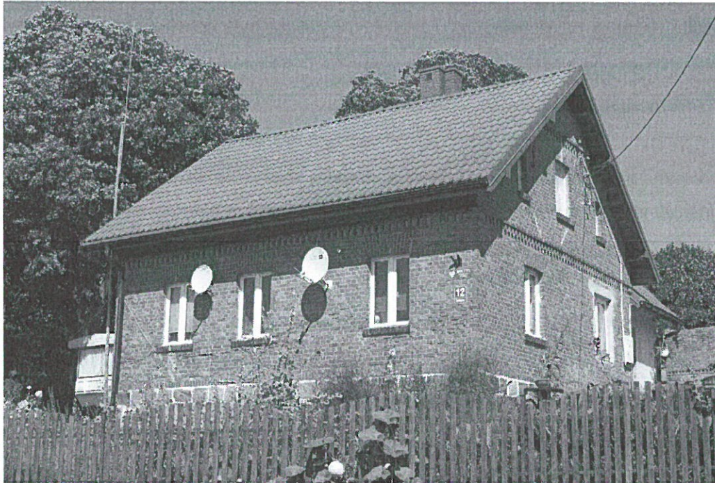
Murowany dom z końca XIX – początku XX w. we wsi Bolejny