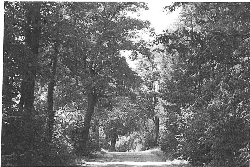
Zabytkowa aleja przydrożna wzdłuż drogi Bartoszkki-Nidzica

państwowym, w pierwszej kolejności zakładane był wzdłuż głównych tras komunikacyjnych, potem wzdłuż dróg o znaczeniu lokalnym. Towarzysty również drogom łączącym majątki z folwarkami. Zwykle aleje dochodziły do granicy wsi. W zadrzewieniach alejowych stosowano gatunki drzew długowiecznych, dobrze znoszących tutejsze warunki klimatyczne, m.in. dąb, jesion, lipa, grab, klon, brzoza.