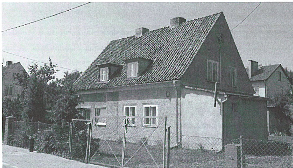
Dom socjalny z drugiej połowy lat 20 – pierwszej połowy lat 30. XX w. przy ul. Robotniczej w Nidzicy

Zabudowa wiejska w województwa warmińsko-mazurskim jest drewniana i murowana. Już na początku XX w. typowym elementem wiejskiej zabudowy stał się murowany budynek mieszkalny, z murowanymi lub drewniano-murowanymi zabudowaniami gospodarczymi. W